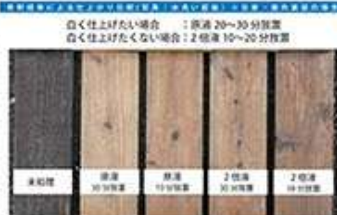
画像①仕上げり具合