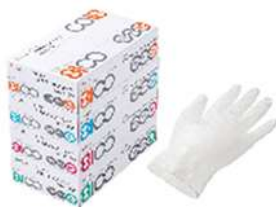
①シンガープラスチックグローブ NO.8100(PVC)

袋「お手軽ビニール手袋」と「シンガープラスチック手袋 No.8100」（画像①）にて比較検証。どちらも柔軟性はありますが、伸縮性はあまりありません。フィット感は、M・Lとはめてしっくり来たのがシンガープラスチック手袋でした。お手軽ビニール手袋は、Mだと少し窮屈に感じ、私の手にはシンガープラスチック手袋の方が合っている感じがしました。