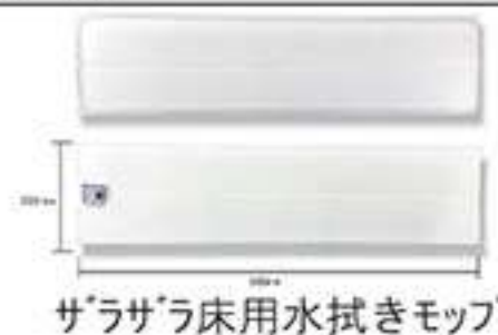
ザラザラ床用水拭きモップ

モップメーカーセイワの自信作「ザラザラ床用水拭きモップ MZR-500-5」のご注文を心よりお待ちしております。