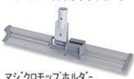
マジクロモップホルダー