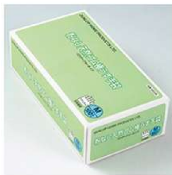
②粉なし天然ゴム極薄手袋

た時のフィット感は良く伸縮性もあって使用感も抜群でした、その中でもひと際肌触りが良く柔らかく感じたのがダンロップ粉無し天然ゴムでした。