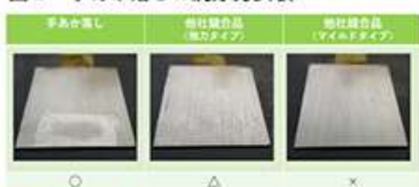
図1 手アカ落としの洗浄力試験

● 洗浄力試験 ● 試験方法：自社洗浄力試験 一作成した人工皮膚を液剤0.5mLで拭き取り試験 洗浄面積と残滓性(拭き残り)で比較・評価した。