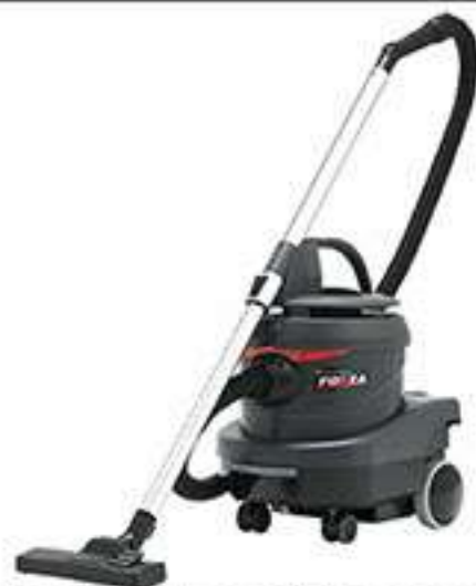
充電1000回で約80%の残容量

(A) / 64dB (A) / 65dB (A) オプション品として、HEPAフィルターやシリコンパンパー他、複数台ご使用の際の充電スペースをコンパクトにできる充電台セットもございます。フォルツァFORZA(Aイタリヤ語:力、パワー)の名の通り、吸引力の強いコードレス掃除機となっております。デモ機もご準備しておりますので、ぜひお試しください。よろしくお願いたします。