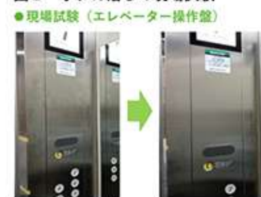
図2 手アカ落としの現場試験

● 洗浄力試験 ● 試験方法：自社洗浄力試験 一作成した人工皮膚を液剤0.5mLで拭き取り試験 洗浄面積と残滓性(拭き残り)で比較・評価した。